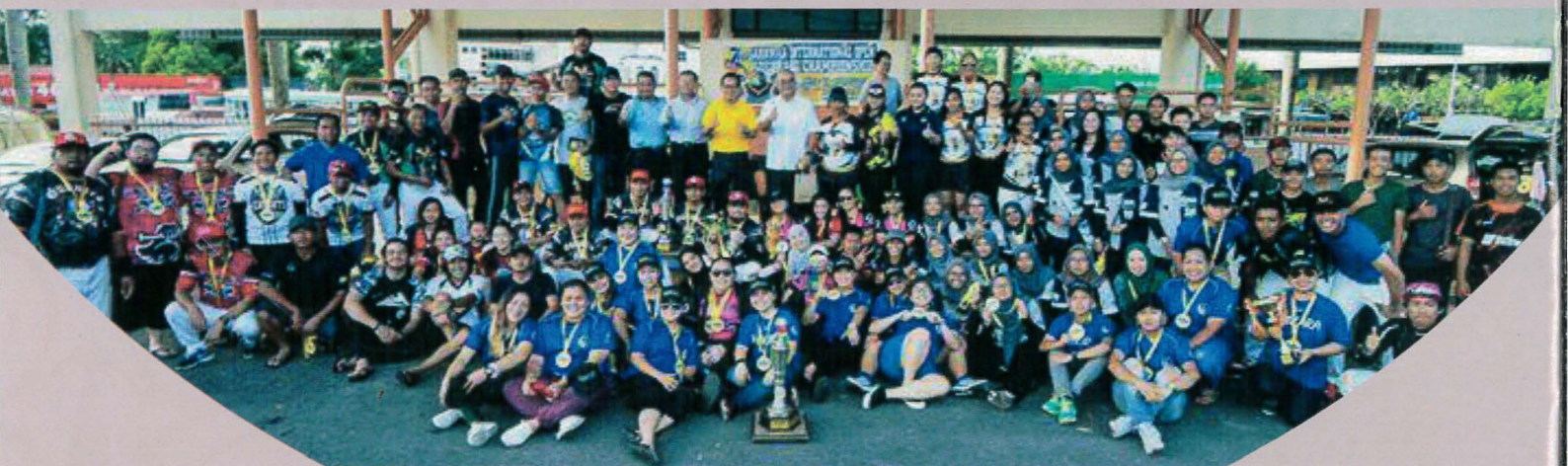
Tempat Ke-tiga di Kejohanan Sofbol AB Terbuka Sarawak 2017