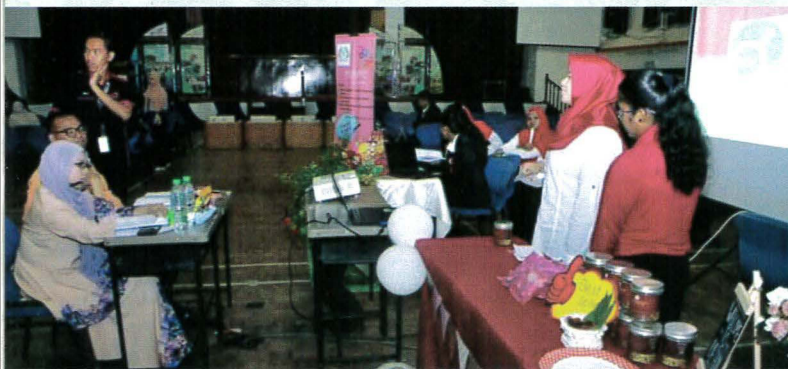
Pembentangan di hadapan panel penilai

Pemarkahan dinilai dari sudut penyediaan proposal, laporan akhir dan juga pembentangan akhir yang kemudiannya dipertandingkan. Pelaksanaan Marketing Plan adalah melalui penghasilan produk inovasi oleh pelajar beserta satu pelan pemasaran produk tersebut. Program ini bertujuan menghasilkan graduan pemasaran yang mampu memberikan kesan yang besar dalam pemasaran sebenar dalam aspek perancangan, kreativiti dan inovasi. Di samping itu juga, pelajar-pelajar lain berpeluang melihat pameran booth produk hasil buah fikiran pelajar ini.