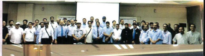
Bergambar kenangan dengan pihak industri