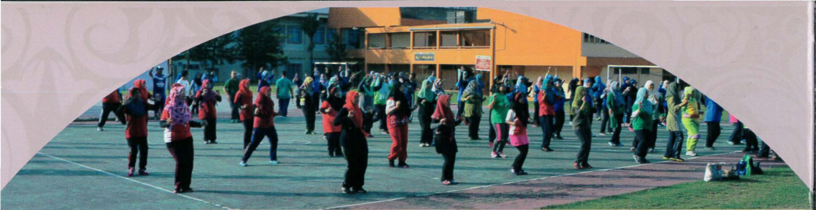
Hari Sukan Staf PPD 2017