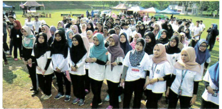
Peserta tekun mendengar taklimat dari pihak penganjur