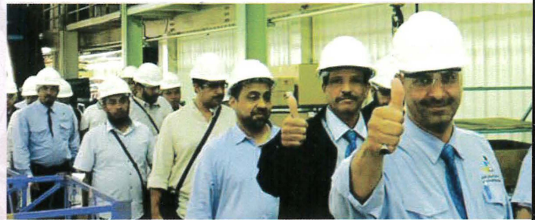
Perkongsian ilmu dengan pihak industri