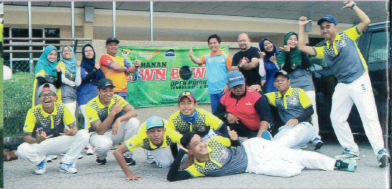
Lawn Balls Team Politeknik Malaysia 2017