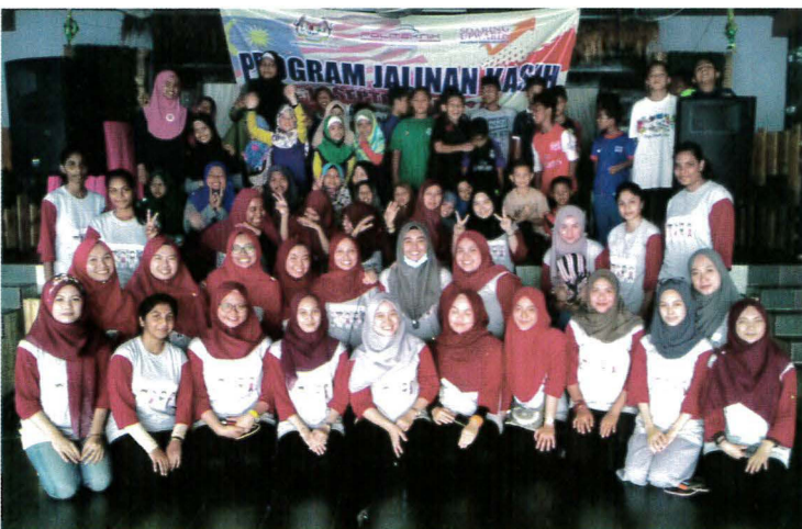
Pelajar bersama penghuni Rumah Kasih HARmoni