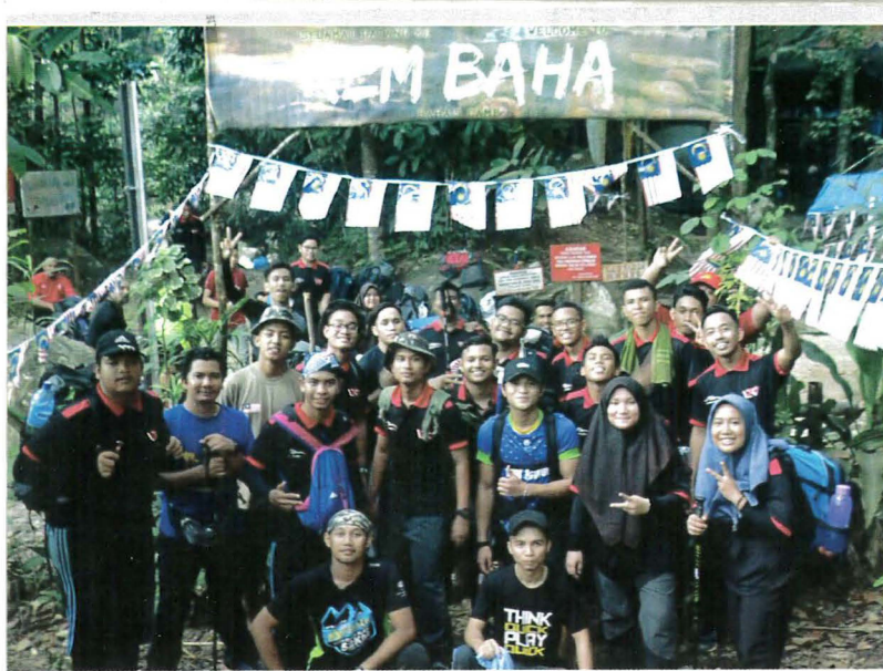
Pendakian ke Puncak Gunung Stong