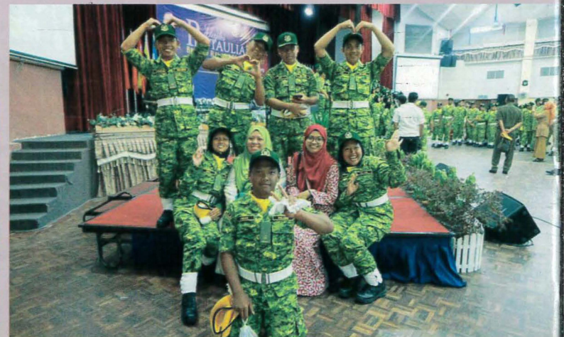
Majlis Pentauliah RELASIS di PSP 2017