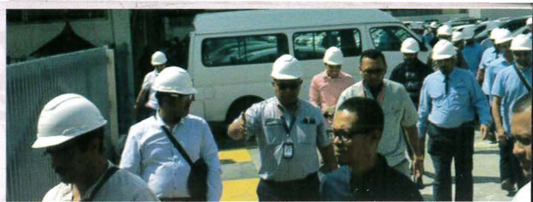
Lawatan ke industri

It is hoped that with the knowledge gained through the program, all the delegates will be able to apply the new knowledge and techniques in the field of Automotive when they are back to serve in their country later. It is recommended that such program can be implemented to delegates of other countries as well.