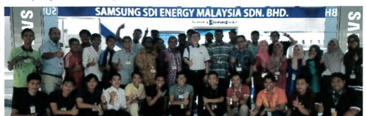
Sesi bergambar di Samsung SDIEM

Di Samsung SDIEM, para pelajar diberi pendedahan yang menyeluruh dari segi latar belakang syarikat, peraturan keselamatan yang perlu diikuti dan pemeriksaan keselamatan yang dijalankan di dalam premis Samsung SDIEM. Di samping itu, mereka diberi peluang keemasan untuk melihat sendiri secara "life" di "production line" tentang proses penghasilan suatu sel bateri, di mana ia merupakan satu pengalaman yang amat bernilai. Di sebelah petang pula, para pelajar didedahkan mengenai teknologi tinggi terkini dalam industri pembuatan minuman Yakult dan potensi bakteria baik pada masa kini. Secara keseluruhannya, para pelajar memberi maklum balas positif bahawa lawatan akademik ini memberi banyak input baru yang boleh diadaptasikan di dalam menempuh alam kerjaya kelak.