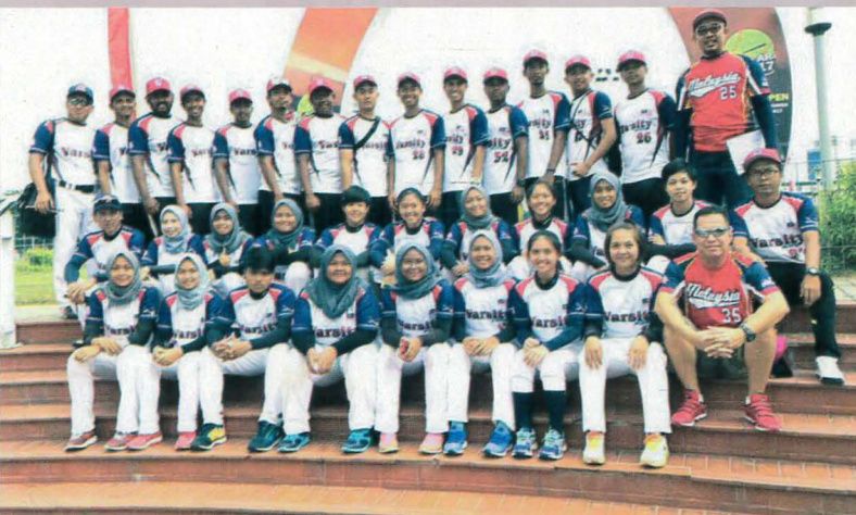
Team Varsity Malaysia

Sepanjang bulan Jun hingga Disember 2017, pelbagai aktiviti di dalam dan di luar PPD telah dilaksanakan oleh Jabatan Sukan, Ko-Kurikulum dan Kebudayaan. Sebagai sebuah jabatan yang bertanggungjawab merancang dan melaksanakan aktiviti sukan, ko-kurikulum dan kebudayaan, pelbagai aktiviti dan kejayaan yang telah dicapai dan ini secara tidak langsung telah dapat menaikkan lagi nama PPD. Diharapkan dengan sokongan padu dari semua pihak samada pengurusan, pensyarah dan pelajar, lebih banyak kejayaan akan dicapai di masa akan datang.