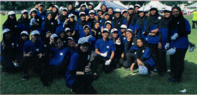
Kontinjen Perbarisan PPD di Sambutan kemerdekaan Negeri Sembilan 2017