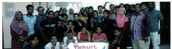
Bergambar kenangan di ruang legar utama Yakult Seremban

21 Sept – Program Lawatan Sambil Belajar ke Samsung SDI Energy Sdn Bhd dan Yakult Factory, merupakan salah satu aktiviti P&P yang dirancang oleh pensyarah-pensyarah Jabatan Kejuruteraan Mekanikal, Politeknik Port Dickson. Seramai tiga puluh dua orang pelajar telah mengikuti lawatan industri tersebut dengan diiringi oleh 4 orang pensyarah. Tujuan program ini dijalankan adalah untuk memberi pendedahan yang mendalam kepada pelajar-pelajar bagi kursus DJF6102- Quality Control atau/dan DJF6092- Manufacturing Control , berkaitan dengan pengurusan pengeluaran dan kualiti secara khususnya di industri pembuatan multinasional yang bertaraf prestij di dalam penghasilan sel bateri mahupun minuman sihat.