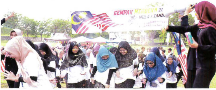
Permulaan pertandingan walkathon