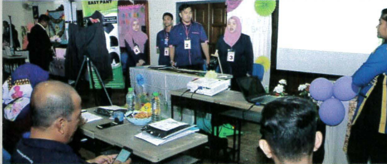
Pembentangan oleh pelajar

18 Sept – Pembentangan Projek Akhir Pemasaran Sesi Jun 2017 memberi peluang kepada pelajar DPR semester akhir memperagakan produk inovasi masing-masing untuk dinilai seterusnya dipertandingkan dengan cemerlang pada program Marketing Plan Presentation Day, di Dewan Wawasan, PPD.