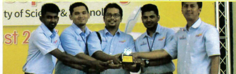
Piala Gangsa Untuk Kategori RobotSoccer

23 – 27 Ogos – Pertandingan 22nd Federation of International Robot Soccer Association (FIRA) RoboWorld Cup & Congress 2017 telah berlangsung selama 5 hari bertempat di National Kaohsiung First University of Science & Technology, Kaohsiung, Taiwan. Pertandingan Robot Soccer bagi 5 kategori yang dipertandingkan adalah kategori MiroSot, SimuroSot, RoboSot, AndroSot, dan Hurocup. Pasukan Robotics Interest Group (RIG) sekali lagi menggalas tanggungjawab penyertaan PPD mewakili negara dalam kategori ROBOSOT, selaras dengan kemenangan 1 pingat emas, 1 pingat perak dan 1 pingat gangsa dalam Kategori RoboSot Pertandingan 10th FIRA Malaysia Cup & Congress 2017 bulan Mei yang lalu.