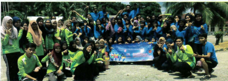
Peserta program Team Building DSK

Tahniah dan syabas kepada pasukan RIG PPD yang telah berjaya mengharumkan nama negara dengan memenangi SATU (1) pingat perak dalam Robosot (Avoidance Challenge) dan DUA (2) pingat gangsa dalam Robosot (Passing Challenge) dan Robosot (Soccer 3 vs 3). Penyertaan pasukan RIG PPD dalam kejohanan antarabangsa ini merupakan satu usaha yang memberi impak kepada perkembangan teknologi robotik Negara. Semoga usaha dan komitmen ini akan terus memberikan kejayaan demi kejayaan kepada PPD pada masa akan datang.