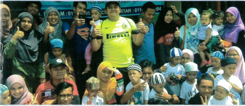
Sesi bergambar bersama kanak-kanak asnaf, fakir miskin dan yatim-piatu

30 SEPT – Penghuni rumah anak yatim, Rumah Amal Akhlak Mulia di Selayang Baru, Batu Caves, Selangor telah menerima kunjungan muhibbah dan amal bakti daripada 50 orang pelajar Diploma Perakaunan semester 5, Politeknik Port Dickson pada September lalu.