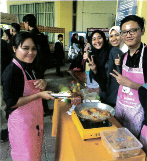
Peserta menyediakan makanan bertema Korea dan Jepun