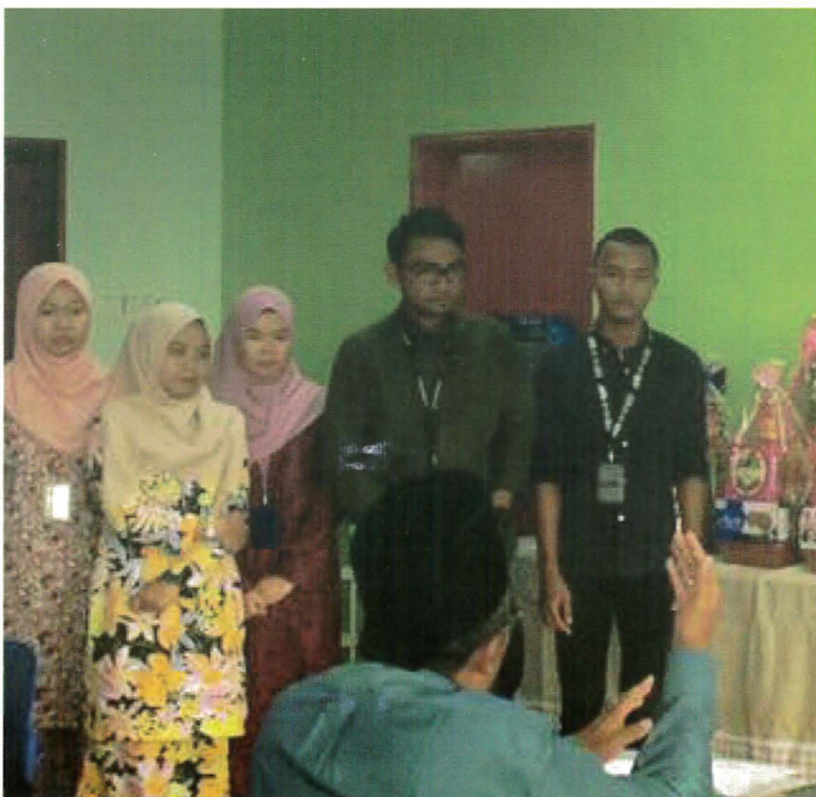
Pembentngan oleh pelajar