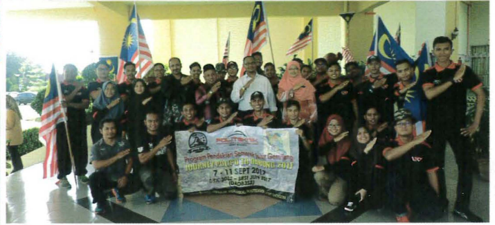
Perlepasan peserta pendakian oleh Tuan Pengarah