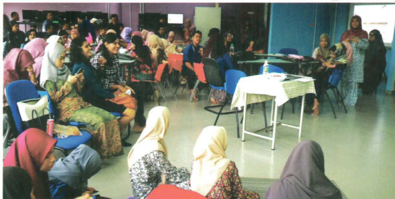
Maklumbalas panel penilai semasa sesi pembentangan

9 Okt – Program Commercial Advertisement Competition 2017 anjuran Jabatan Perdagangan, PPD berjaya mencungkil bakat 76 pelajar DPR semester 4 melalui pembelajaran kreatif dalam menghasilkan video iklan bertemakan Provide Knowledge Advertisement bertempat i-Smart Classroom, TeCC, PPD.