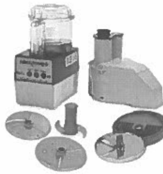
Figure A Rajah A

CLO 1 7. Based from the picture in figure A above, identify the equipment.