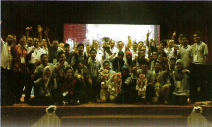
Kemenangan besar milik kontingen PPD dalam pertandingan Robotik 7th FIRA 2014