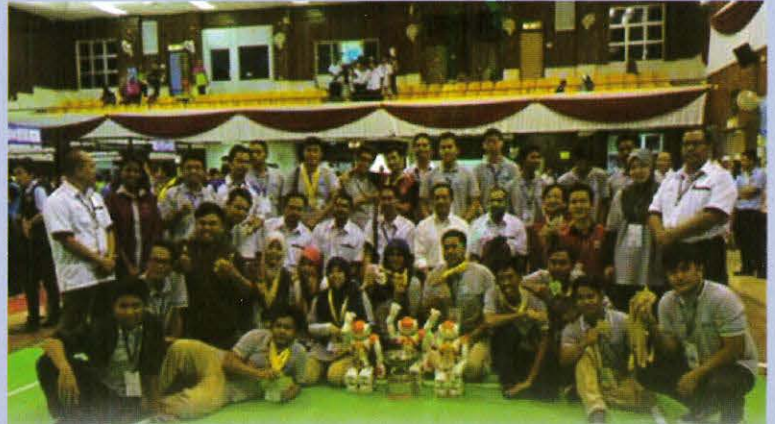
Kemenangan kontingen PPD atas komitmen dan usaha berterusan dapat memonopoli kejuaraan Robotik FIRA 2014 di Politeknik Tuanku Sultanah Bahiyah, Kulim

19-23 Mei - RIG PPD (Robotics Interest Group) dinobatkan juara keseluruhan Pertandingan Robotik 7th FIRA Malaysia Cup 2014 yang berlangsung selama 4 hari di Politeknik Tuanku Sultanah Bahiyah (PTS), Kulim, Kedah. Pertandingan kali ini disertai oleh 19 Politeknik Malaysia dan Universiti Malaysia Perlis merupakan satu platform ke peringkat kebangsaan menerusi elemen pembangunan inovasi dan kreatif dalam bidang robotik. RIG PPD menghantar kontingen terbesar dalam kejohanan berkenaan memperolehi lima emas daripada enam kategori yang dipertandingkan iaitu HuroCup, RoboSot, MiroSot, SimuroSot, dan MyBot kecuali AndroSot. -Norhadfiah Mohd Husni