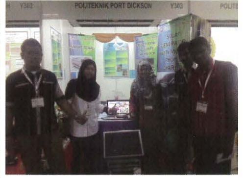
Pelajar dan pensyarah JKM yang terlibat dalam lawatan ke MTE 2015

Feb - Unit Projek JKM telah membuat program lawatan ke Pameran Inovasi sempena MALAYSIA TECHNOLOGY EXPO 2015 (MTE 2015) peringkat kebangsaan yang telah diadakan di PWTC Kuala Lumpur. Seramai 60 pelajar dan 20 pensyarah telah mengikuti program ini. Pameran ini disertai oleh pelbagai agensi kerajaan dan swasta dalam kategori akademik dan bukan akademik pelbagai negara. Pelbagai produk yang dipamerkan dari pelbagai agensi dalam dan luar negara dalam usaha memasarkan produk hingga menembusi pasaran dalam dan luar negara. Malah ada juga produk yang masih dalam pembangunan lagi. Ini memberi peluang produk tempatan meluaskan pasaran ke tahap yang lebih global. Maklumat yang diperolehi daripada lawatan ini, para pensyarah dan pelajar dapat menjana idea-idea dalam membina inovasi terkini dan kajian di masa hadapan. - Nor Hafidzah Mohd Husni