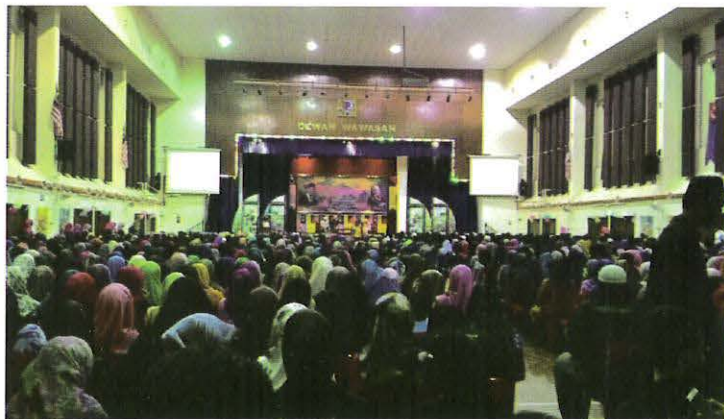
pelajar membanjiri dewan wawasan untuk bersama ikon Imam Muda Hizbur dan Fazurina.