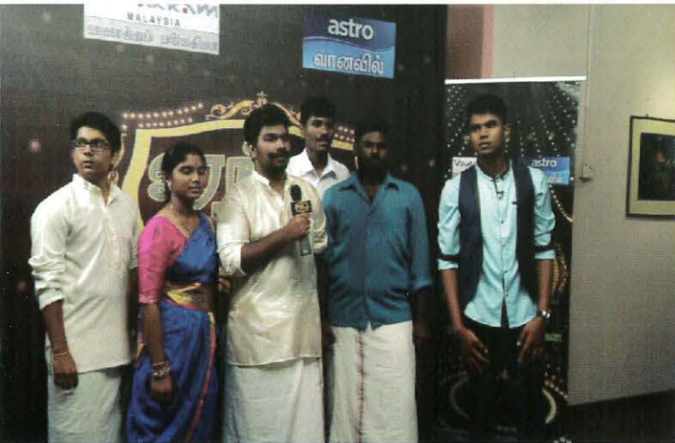
KUMPULAN YANG BERJAYA MASUK KE PERINGKAT AKHIR "ORANGGA NADAGAM"