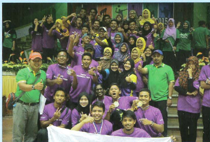
Team PoliPD MSP 4