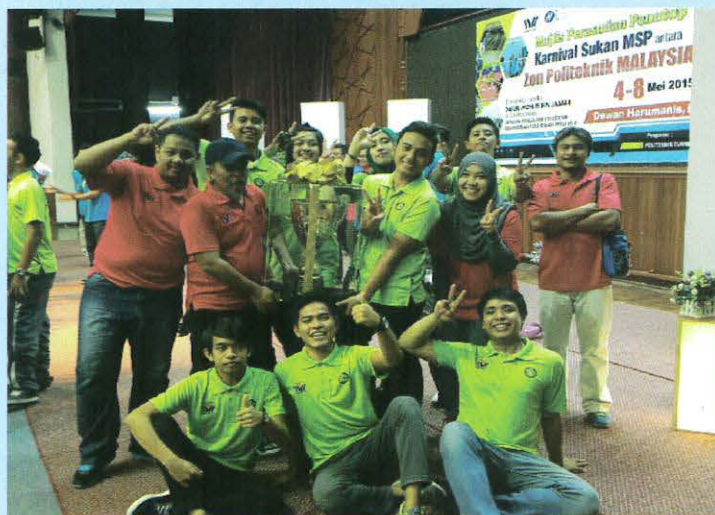
Team Badminton Zon Selatan

Mei – Sekali lagi Pasukan MSP Zon Selatan gabungan 5 politeknik iaitu Politeknik Port Dickson (PPD), Politeknik Merlimau (PMM), Politeknik Melaka (PMK), Politeknik Ibrahim Sultan (PIS), Politeknik Mersing (PMJ) dan Politeknik Metro JB (PMJB) cemerlang dalam Karnival Sukan Grand Final 2015 pada 4 hingga 8 Mei 2015 di PTSS, Perlis. Keputusan Kontinjen Zon Selatan sebagai Johan keseluruhan Grand Final MSP 2015 setelah memperolehi 7 Emas, 7 Perak dan 6 Gangsa melalui 6 acara sukan. Sebelum ini pertandingan di peringkat zon di Politeknik Merlimau, PPD mengungguli acara bola tampar, boling, sepak takraw, bola jaring dan badminton. Kemenangan 3 emas disumbang oleh Pasukan Bola Tampar Wanita, Beregu Wanita dan Beregu Lelaki (Badminton, manakala 6 perak disumbangkan oleh Single dan Double Event (Tenpin Bowling), Pasukan Bola Tampar Lelaki, Beregu Lelaki A, Pasukan Takraw B dan Perseorangan Lelaki (Badminton) dan 2 gangsa diperolehi dalam acara Bola Jaring Wanita dan Men Singles (Tenpin Bowling).--Azharizal