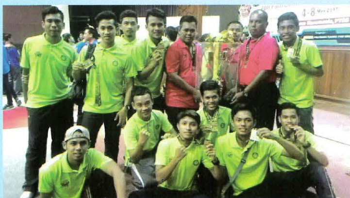
Team Takraw Zon Selatan 1