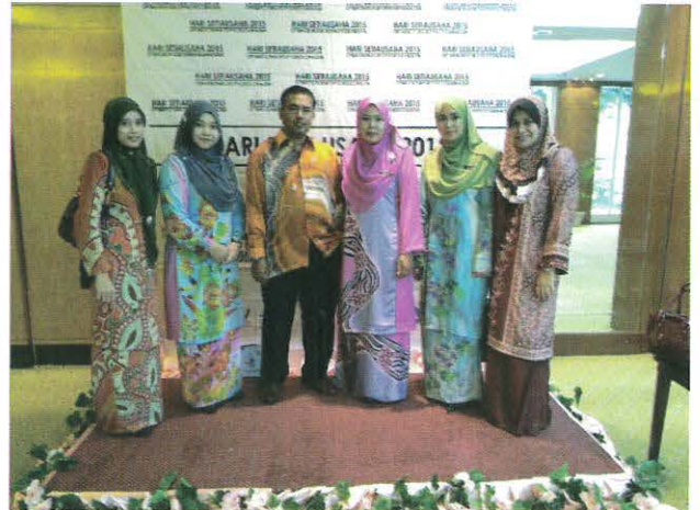
Ketua Jabatan Perdagangan dan pensyarah yang hadir di majlis tersebut.