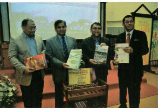
Perasmian Seminar Kolokium Penyelidikan dan Pendidikan Kebangsaan (NaREC'2015)