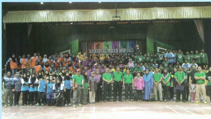
Team PoliPD MSP 3