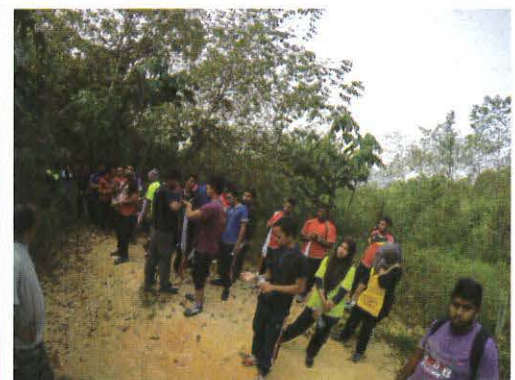
Aktiviti dalam Program Kasih The Hope di Kem Rimba Ria, Ulu Langat

Mac - JKE telah mengambil inisiatif baru bagi meningkatkan prestasi akademik pelajar-pelajar yang mendapat keputusan Kedudukan Bersyarat (KS) dan Gagal Berhenti (GB) pada sesi Jun 2014 lalu dengan menganjurkan Program Kasih 'The Hope' JKE. Seramai 53 orang pelajar terpilih mengikuti program ini selama 3 hari di Kem Rimba Ria, Hulu Langat. Ianya bertujuan untuk memberi suntikan semangat kepada para pelajar agar terus berusaha keras dalam akademik mereka. Tiada istilah pensyarah meminggirkan pelajar dalam bilik kuliah gara-gara lemah belajar. Malahan dorongan dan semangat yang dipulihkan sedikit sebanyak akan menyuntik kembali keinginan mereka untuk terus berusaha memperbaiki kelemahan diri. -Muhaini