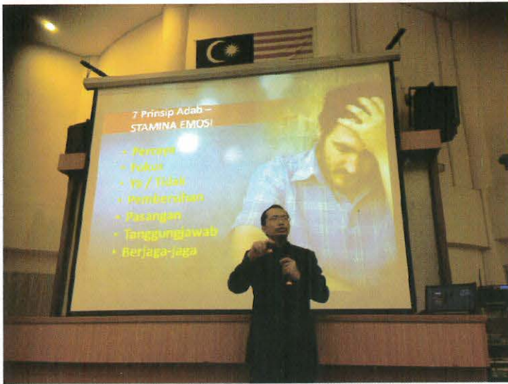
Penceramah sedang menyampaikan ceramah motivasi