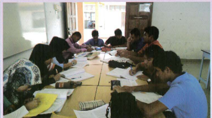
Kelas Pemulihan Sesi Dis 2014-5