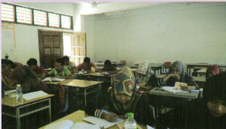
Kelas Pemulihan Sesi Dis 2014- 1

Mac - 105 pelajar mengikuti kelas pemulihan Kursus BA 201 dan DBS 1012 anjuran Jabatan Matematik Sains dan Komputer (JMSK). Fasilitator dilantik dari kalangan pensyarah JMSK berjaya memberikan komitmen sepenuhnya dalam penyediaan ABM, soalan-soalan lepas dan aktiviti pelajar. Pihak JMSK akan meneruskan aktiviti ini pada semester hadapan dengan penjenamaan baru agar pelajar berminat menghadiri aktiviti ini. - Siti Morni