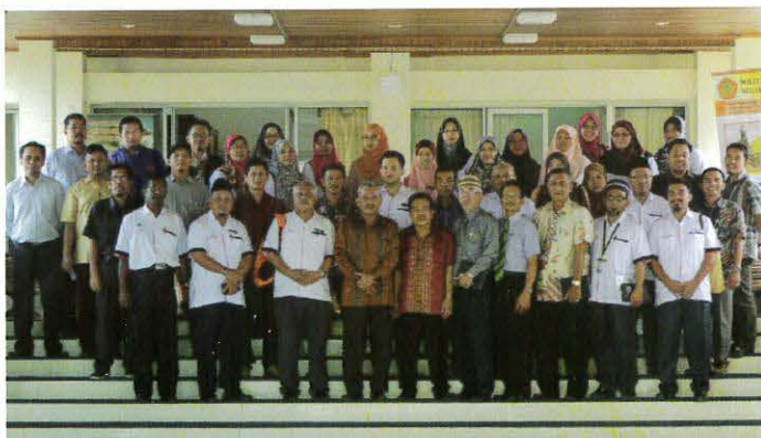
Delegasi PPD ceria bergambar kenangan bersama staf dan pensyarah PNP di kampus Politeknik Negeri Padang, Limau Manis Padang Indonesia

Jan - Lawatan delegasi dari PPD di kalangan pensyarah dan pegawai ke Politeknik Negeri Padang dalam rangka untuk meluaskan lagi rangkaian kerjasama dengan institusi luar negara. Ini selaras dengan kehendak Pelan Strategik Pendidikan Tinggi Negara (PSPTN) dan ISTN Jakarta dan Politeknik Negeri Medan yang telah sedia terjalin.