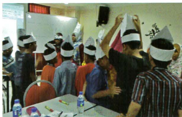
Salah satu aktiviti yang dijalankan