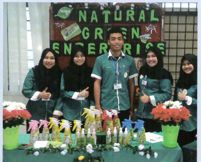
Kumpulan Natural Green Enterprise antara kumpulan yang menghasilkan produk yang kompeten.

Objektif kursus ini adalah untuk menguji sejauh mana para pelajar menguasai konsep pemasaran, merancang dan merekabentuk satu pelan pemasaran yang komprehensif. Selain memupuk budaya kerja yang kreatif dan inovatif di kalangan para lulusan politeknik. Aspek-aspek seperti kerjasama berkumpulan, ketepatan masa dan budaya penyelidikan menjadi elemen penting dalam pelaksanaan kursus ini. Kali ini pihak jabatan mendapat khidmat juri penilai dari Politeknik Medan, Indonesia Ibu Efni Siregar dan Ibu Nursiah Burhan, dan panel dari agensi tempatan seperti Etiqa Takaful, BFM Media dan Creative Energy Resources. - Juhana