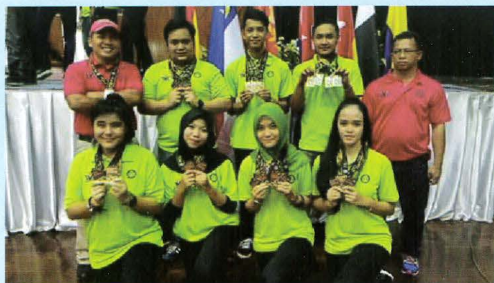
Team Tenpin Bowling Zon Selatan 2015