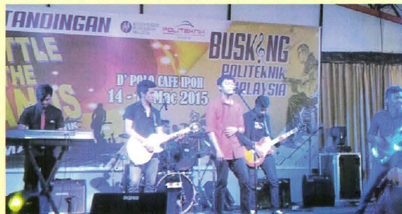
Kumpulan Kecut and The Megatron Politeknik Port Dickson